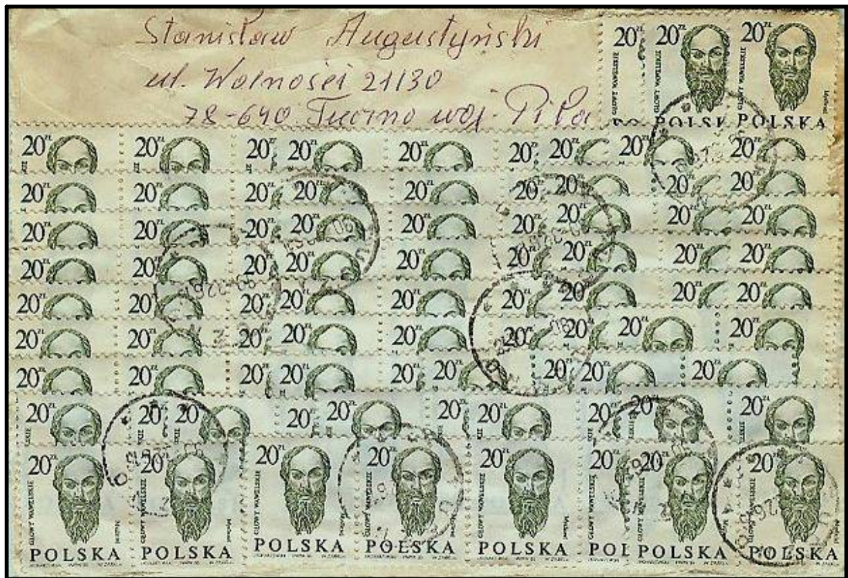
Beleg 4: 1.900 Zi (LP-Brief) vom 26.3.1990 aus Tuczno 95 Marken zu 20 Zi; 84 Stück wurden aus Platzmangel auf die Rückseite geklebt. Man nennt dies auch Dachziegel- oder Treppenfrankatur.